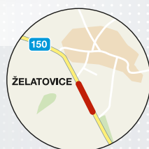
Želatovice (Olomoucký kraj) 216 metrů silnice silnice II/150 v katastru obce Želatovice nedaleko Prerova