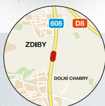
Zdíby (Středočeský kraj) 99 metrů silnice I/608 v katastru obce Zdíby nedaleko hranic s hlavním městem