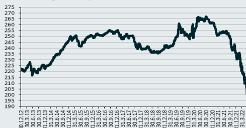
Bloomberg Barclays Czech Index

Česká výnosová křivka se v červnu dále posunula nahoru za současného zvýšení míry inverze. Na krátkém konci výnosy vlivem dalšího utažení měnověpolitických sazeb ČNB vyrostly o 80 b.b., takže se dostaly na 6,6 %. Na dlouhém konci došlo také k citelnému růstu, nicméně mírnějšímu, o zhruba 40 b.b. na 5,1 %.