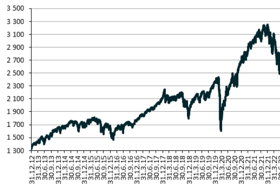
MSCI World Index

Lépe než trhům vyspělým se vedlo středoevropským akciovým indexům. Místní trhy si výraznými korekcemi prošly již v dřívějších měsících, také centrální banky přistoupily mnohem dříve k boji proti inflačním tlakům skrze zvyšování úrokových sazeb. Při vysokých cenách silové elektřiny se dobře vedlo akciím polských utilit (PGE, Enea a Tauron), naopak z obav z růstu odpisů nesplacených pohledávek a riziku zavedení sektorových daní ztrácely akcie bank, nejen v Polsku a Maďarsku. Na pražskou burzu vstoupila zajímavá emise zástupce práškové metalurgie ze Slovenska, společnost Gevorkyan. Jedná se o vysoce automatizovanou výrobu, s minimem odpadu, silným know-how a téměř 100 % využití kapacit. V ČR také rezonovaly zprávy ohledně „zestátnění“ ČEZu a návržení sektorové daně jedním z koaličních partnerů. Český index PX v červnu umazal 4,4 %, polský index WIG30 -7,8 %, maďarský index BUX -0,4 % a rumunský index BET -1,7 %.