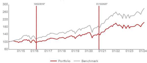
EVOLUTION OF CUMULATIVE PERFORMANCES (%)

Prosím vezměte na vědomí, že informace uvedené v tomto informačním listu se týkají podkladového fondu v měně EUR a liší se od cen a výkonnosti fondu na Vaší pojistné smlouvě z důvodu přepočtu cizí měny do CZK a také z důvodu uplatnění poplatku za správu ve smyslu pojistných podmínek. Rovněž počátek obchodování pokladového fondu je odlišný od datumu zavedení fondu v GČP.